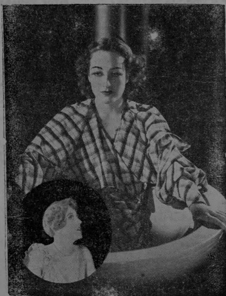
Joan Crawford es el ejemplo perfecto de una mujer que se ha embellecido con su trabajo en el cine, "dice Max Factor."

la pantalla como en la de cualquier otra mujer, sea cual sea su profesión. Fíjese con cuánta claridad y belleza destacan las facciones de Joan Crawford en el segundo retrato. Ese pelo de tan lindísimo color caoba ha sido peinado de manera de formar un marco perfecto a su semblante. Los ojos tienen ahora más intensidad, más expresión, parecen decir más... Esto lo ha logrado Joan con la sombra, el maquillaje y el creyón de cejas, aplicado como es debido.